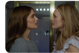
118 Min. Regie: Todd Haynes. Drehbuch: Samy Burch. Darsteller: Natalie Portman, Julianne Moore, Charles Melton, Cory Michael Smith, Piper Curda, Elizabeth Yu