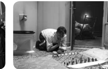
D 2020. 110 Min. R: Philipp Stölzl. B: Eldar Grigorian, nach Stefan Zweig. D: Oliver Masucci, Albrecht Schuch, Birgit Minichmayr, Andreas Lust, Rolf Lassgård, Samuel Finzi u.a.

Wien, 1938: Österreich wird vom Nazi-Regime besetzt. Kurz bevor der Anwalt Bartok mit seiner Frau Anna in die USA fliehen kann, wird er verhaftet und in das Hotel Metropol, Hauptquartier der Gestapo, gebracht. Als Vermögensverwalter des Adels soll er dem dortigen Gestapo-Leiter des Adels Zugang zu Konten ermöglichen. Da Bartok sich weigert zu kooperieren, kommt er in Isolationshaft. Über Wochen und Monate bleibt Bartok standhaft, verzweifelt jedoch zusehends – bis er durch Zufall an ein Schachbuch gerät... Wie schnell kann aus einer freien Gesellschaft ein Unrechtsstaat werden? Und welchen Widerstand vermag ein einzelner Mensch zu leisten? Diese Fragen thematisiert Stefan Zweig in seiner vor rund 80 Jahren erschienenen „Schachnovelle“. Philipp Stölzls Leinwandadaption beeindruckt mit einer herausragenden Besetzung.