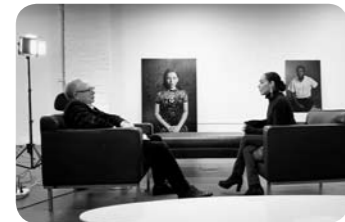
Deutschland 2021, 86 Min. Regie: Hermann Vaske