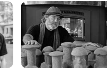
Fantastic Fungi. USA 2019. 81 Min. Regie: Louie Schwartzberg. Darsteller: Paul Stamets, Michael Pollan, Eugenia Bone, Andrew Weil.

FANTASTISCHE PILZE – Die magische Welt zu unseren Füßen nimmt uns mit auf eine fesselnde Reise in ein unterirdisches Netzwerk, das unseren gesamten Planeten umspannt und erstaunliches weitgehend noch unerforschtes Potential beherbergt. Mit den Augen renommierter Wissenschaftler und Mykologen wie Paul Stamets („dem bekanntesten Pilz-Experten der Welt“, SZ Magazin), werden Schönheit, Intelligenz und Lösungen aufgezeigt, die uns das Pilzreich als Antwort auf einige unserer dringlichsten medizinischen, therapeutischen und ökologischen Herausforderungen bietet. Unter der Regie von Louie Schwartzberg ist ein bewusstseinsverändernder Film entstanden, der bereits in den USA für Furore gesorgt und begeisterte Kritiken bekommen hat.